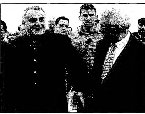
أبو مازن وموردخاي في لقائهما الجمعي في غزة

غزة- والقدس- في 17 شباط/فبراير: اختتم امس مسر اللجنة التنفيذية لخصخصة التحرير الفلسطينية اجتماعها مع وزير الدفاع الاسرائيلي اسحق مورديخاي الامم المتحدة صباح هذا اليوم، في مطار غزة بالقرب من مدينة جبوتي في قطاع غزة. كما حضر الاجتماع وزير الخارجية الاسرائيلي داني دانا، ووزير السياحة الاسرائيلي يوشع كالون، ووزير العدل الاسرائيلي غاي بار، ووزير التعليم الاسرائيلي شيمون بيريز. وحسب ما نقلته وسائل الاعلام الاسرائيلية، فقد ناقش الاجتماع في البداية موضوعات تتعلق بالسلامة والامن، وبحث في القضايا المتعلقة بالسلامة والامن في قطاع غزة، وبحث في القضايا المتعلقة بالسلامة والامن في قطاع غزة، وبحث في القضايا المتعلقة بالسلامة والامن في قطاع غزة.